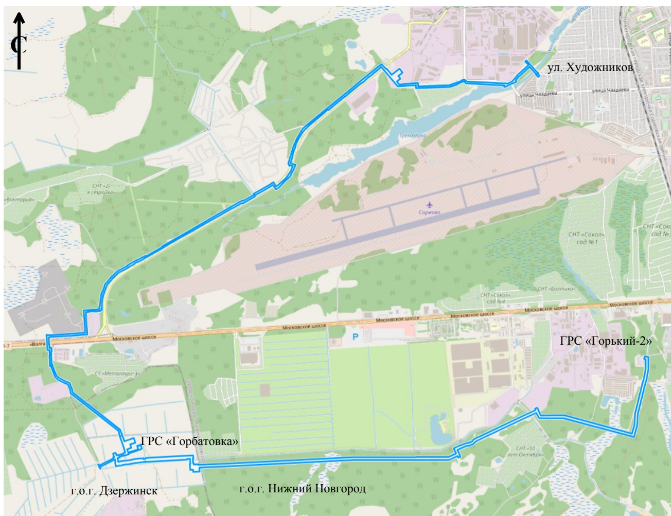
Схема границ подготовки документации по планировке территории (арх. № 45/24)